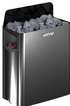
WALL BLACK STEEL