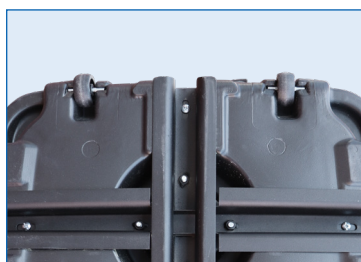
Ruote di trasporto