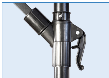
Leva di apertura