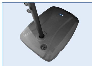
Piede d'acciaio + zavorra