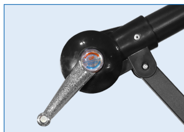
Manovella di movimentazione