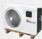
Livraison sur palette bois